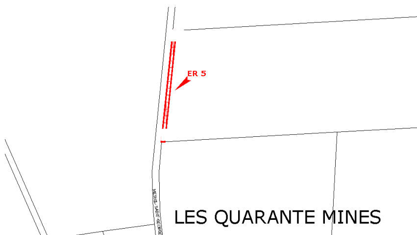
ER 4 : Stockage des eaux – superficie = 302 m 2 - largeur : 3 m